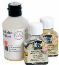
Средства для декупажа

Совет: При декорировании искусственных яиц или скорлупы вы можете использовать любые материалы, а вот если это настоящие яйца, то необходимы пищевые красители, а вместо клея — густой крахмальный клейстер.