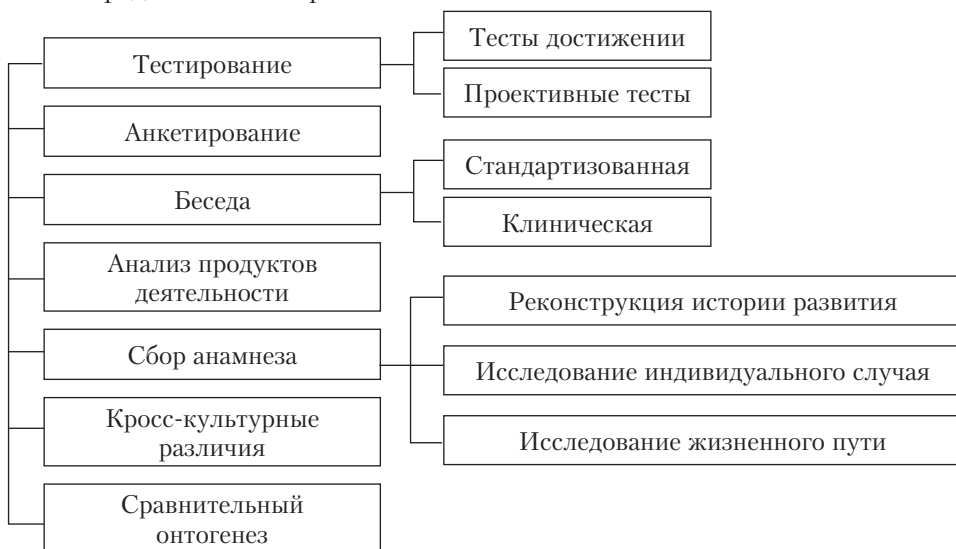
Рис. 1.2. Вспомогательные методы исследования психологии дошкольника

В психологии дошкольника используются вспомогательные методы: тестирование, анкетирование, метод беседы (интервью), метод анализа продуктов деятельности, метод анамнеза, метод кросс-культурных различий, метод сравнительного онтогенеза. Вспомогательные методы схематически представлены на рис. 1.2.