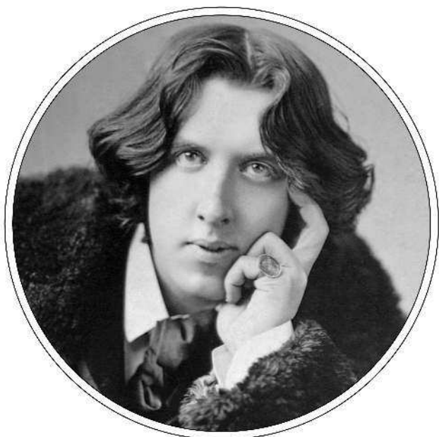
Оскар УАЙЛД (1854-1900)