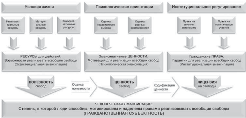
Рисунок 1.1. Концепция человеческой эмансипации

отрицалось бы требование всеобщих свобод. В этом смысле эмансипативные ценности порождают либеральную ограниченность толерантности, нетерпимую к нелиберальным практикам.