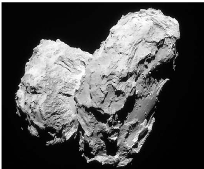
Ядро кометы 67P напоминает резинового утенка.

Анализ данных Philae показывает, что 67P имеет в своем составе (по сравнению с Землей) много большую