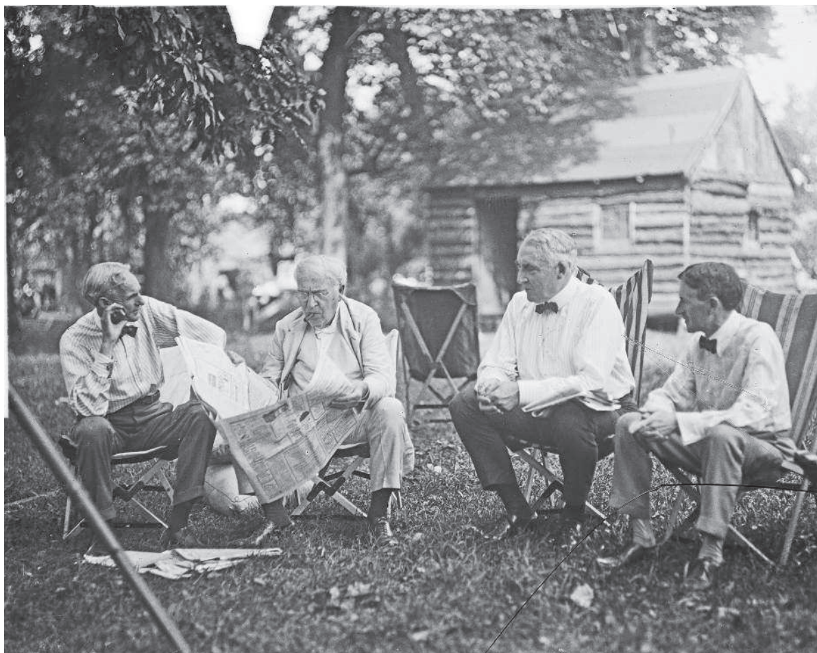
Генри Форд, Томас Эдисон, Уоррен Гардинг и Гарви Файрстоун — титаны автомобильной индустрии во время совместного отдыха в лагере в Пайквилле, Мэриленд.