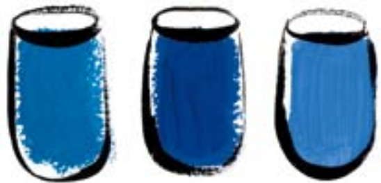
лазурь ультрамарин кобальт

Какой из этих синих тебе больше нравится?