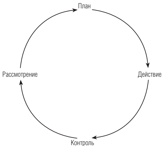
Рис. 1. Цикл управления результативностью

нению поставленных задач и увеличению результативности работы; разработка индивидуальных планов развития для совершенствования знаний, навыков и компетенций сотрудников и мотивации на нужное поведение.