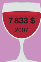
Шато Мутон- Ротшильд 1945