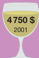
Монраше 1978 Домен де ля Романе-Кнти