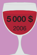
Шато Мутон- Ротшильд 1945