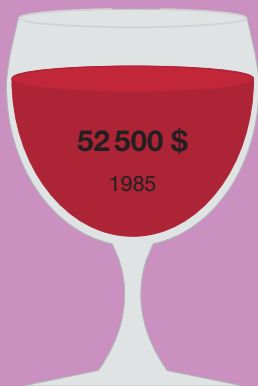
Шато Лафит 1787