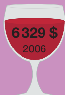
Шато Шваль Блан 1947