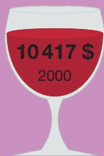
Каберне Скримин игл 1992