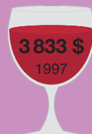
Шато Мутон- Ротшильд 1945