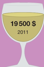
Шато Икем 1787