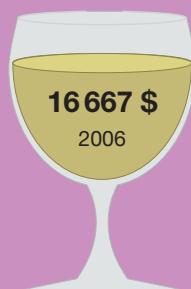
Шато Икем 1787