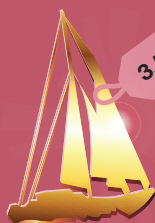
парусная яхта Oyster