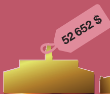
год обучения в Гарвардском университете