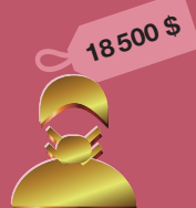
подтяжка лица в Нью-Йорке