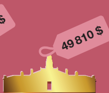
год обучения в Гроутоновской школе довузовской подготовки