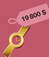
золотые часы Patek Philippe