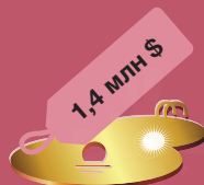
плавательный бассейн олимпийского размера