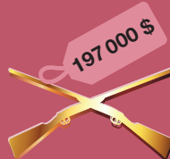
пара ружей Griffin & Howe