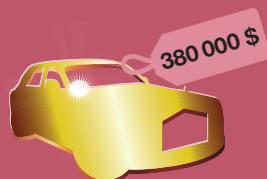
автомобиль Rolls-Royce Phantom