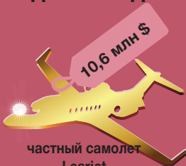
частный самолет Learjet на семь пассажиров