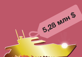
моторная яхта Hatteras