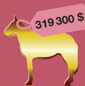
средняя цена чистокровного жеребца