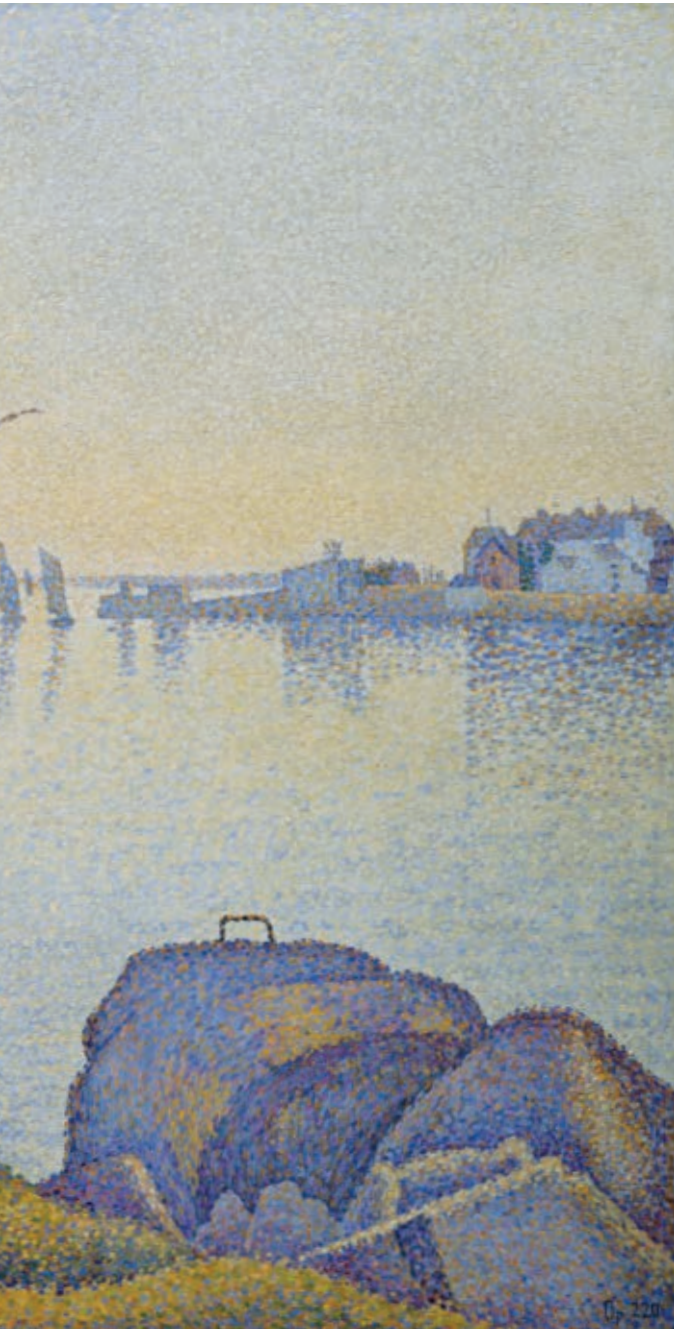
Поль СИНЬЯК «Тихий вечер в Конкарно, опус 220 ( Allegro Maestoso )», 1891

Синьяк (1863–1935) был близким последователем неоиmprессионизма Сёра, и эта картина отражает его точку зрения на цветовую гармонию, представляя контраст желтых и синих тонов. Здесь запечатлены рыболовные лодки — Синьяк был умелым мореходом. Это один из пяти видов Конкарно, написанных художником в том году.